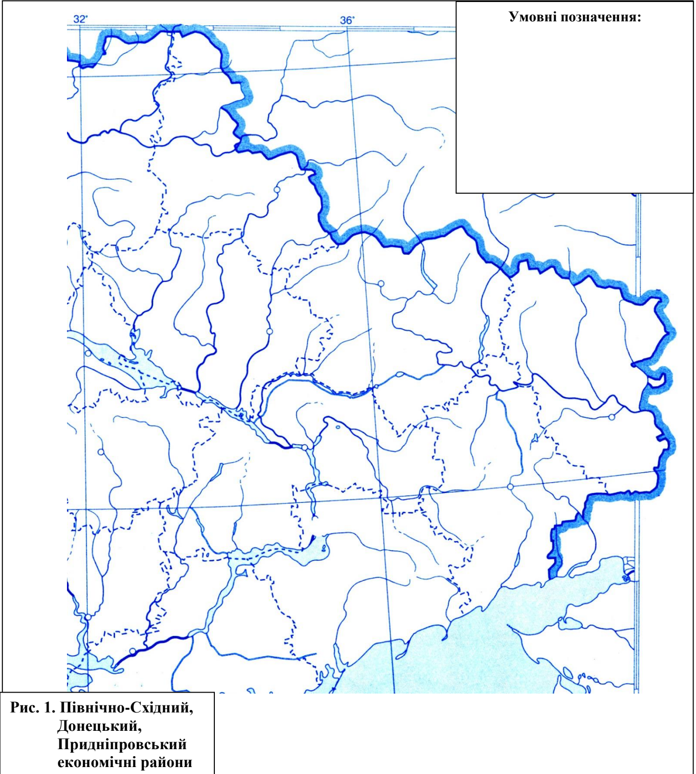
Рис. 1. Північно-Східний, Донецький, Придніпровський економічні райони